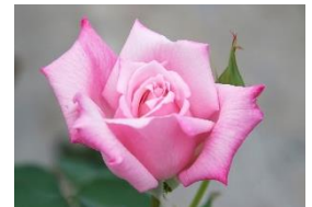
レディラック/ナリス ローズガーデン

【本件への問い合わせ先】株式会社 ナリス化粧品 広報課 横谷（よこたに） 〒553-0001 大阪市福島区海老江1丁目11番17号 TEL:06-6346-6672 mail:narispr@naris.co.jp HP:https://www.naris.co.jp